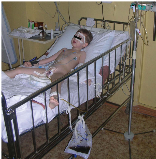
Фото 2. Пациенту с явлениями ОКИ проводится сеанс КЛ. В мочеприемнике соединённом с газоотводной трубкой отмечается накопление бурого патологического интестината.

Photo 2. A patient with symptoms of acute intestinal infection intestinal lavage conducted the session. The urine collection bag connected to the gas outlet pipe marked accumulation of pathological intestinal brown.