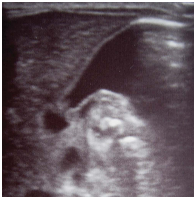
Фото 1. На эхограмме проникновение СЭР за пилорический сфинктер

На начальных этапах мы использовали СЭР 250-260 мосм/л (при рекомендуемом к использованию у взрослых СЭР с осмолярностью 235-260 мосм/л). В начале процедуры в положении больного на правом боку при поднятом головном конце на 25-30° по