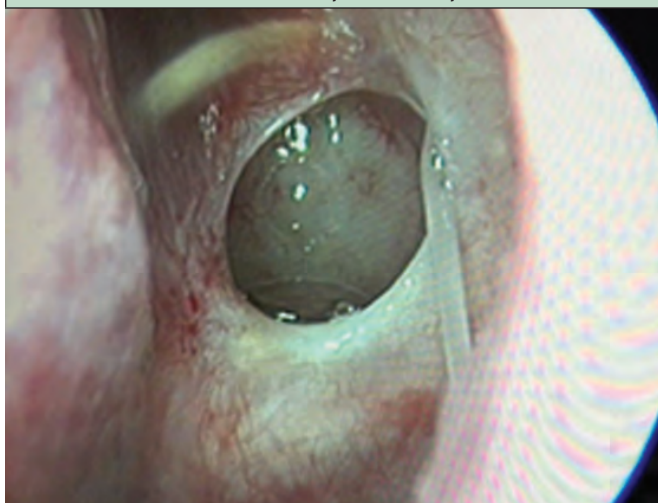
РИСУНОК 2 Расширенный трансназальный доступ. Клетка Оноди. Канал зрительного нерва